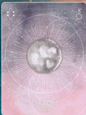
カイロン CHIRON ヒーリング