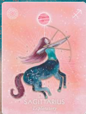
射手座 SAGITTARIUS 探検