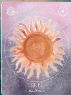
太陽 SUN 輝き