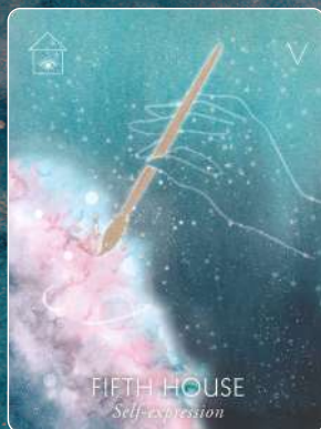
第5ハウス FIFTH HOUSE 自己表現