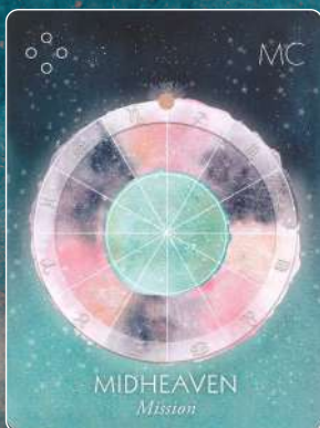
ミッドヘブン MIDHEAVEN 使命