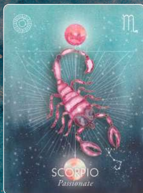
蠍座 SCORPIO 情熱的