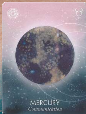
水星 MERCURY コミュニケーション