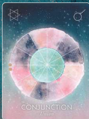
コンジャンクション CONJUNCTION 団結