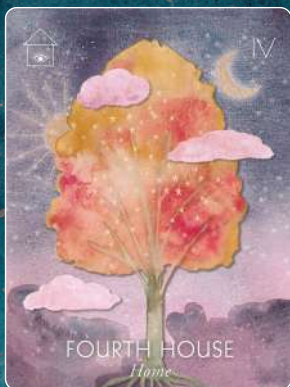
第4ハウス FOURTH HOUSE 家庭