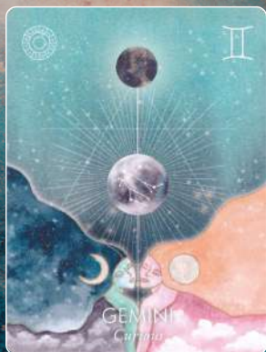
双子座 GEMINI 好奇心