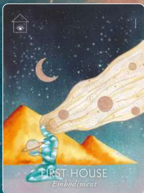
第1ハウス FIRST HOUSE 具現化