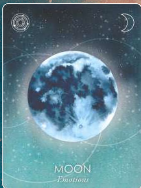
月 MOON 感情