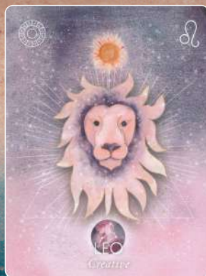
獅子座 LEO 創造的