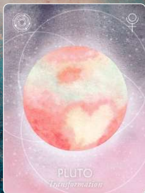
冥王星 PLUTO 変容