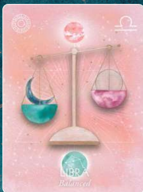
天秤座 LIBRA バランス