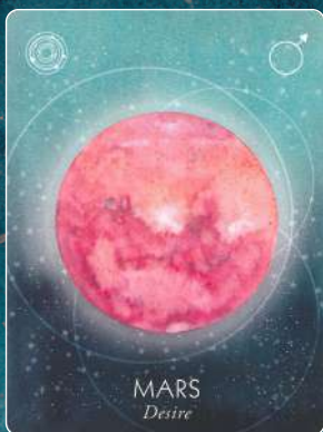
火星 MARS 願望