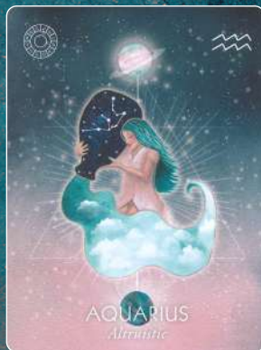
水瓶座 AQUARIUS 利他主義