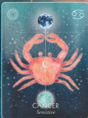
蟹座 CANCER 感受性