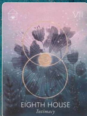
第8ハウス EIGHTH HOUSE 親密さ