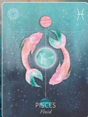
魚座 PISCES 流動的