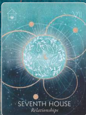
第7ハウス SEVENTH HOUSE 人間関係