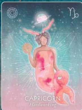
山羊座 CAPRICORN 勤勉