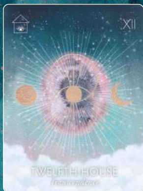
第12ハウス TWELFTH HOUSE 超越