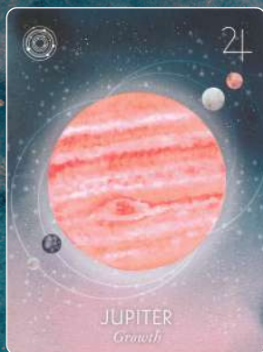
木星 JUPITER 成長