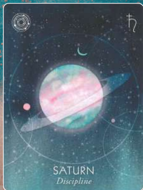
土星 SATURN 自制心