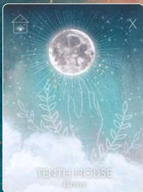
第10ハウス TENTH HOUSE キャリア