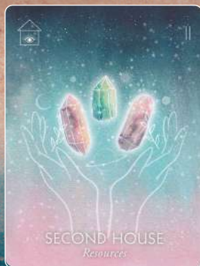
第2ハウス SECOND HOUSE リソース