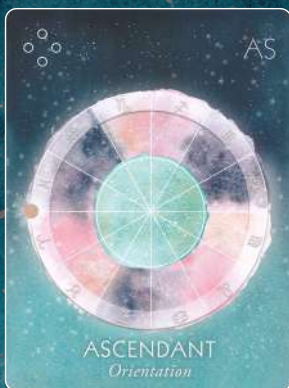
アセンダント ASCENDANT 志向