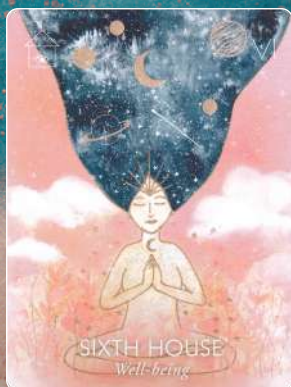
第6ハウス SIXTH HOUSE 健康