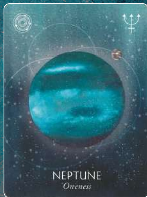
海王星 NEPTUNE ワンネス