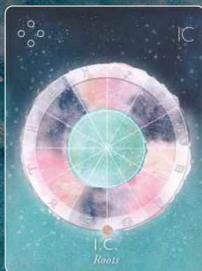
I.C. IMUM COELI ルーツ