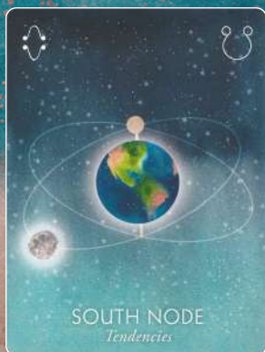
サウスノード SOUTH NODE 傾向