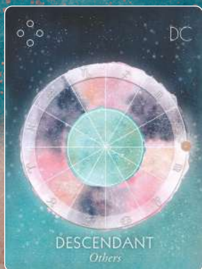
ディセンダント DESCENDANT 他者