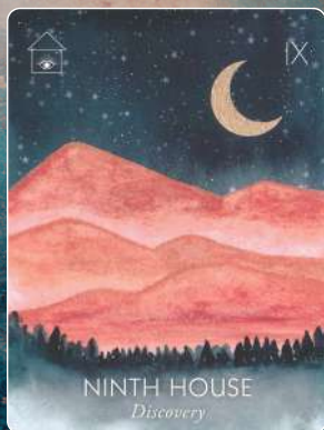
第9ハウス NINTH HOUSE 発見