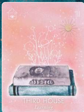
第3ハウス THIRD HOUSE 学習