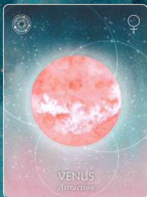
金星 VENUS 魅力