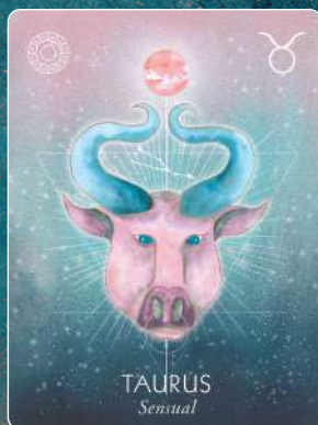
牡牛座 TAURUS 官能的