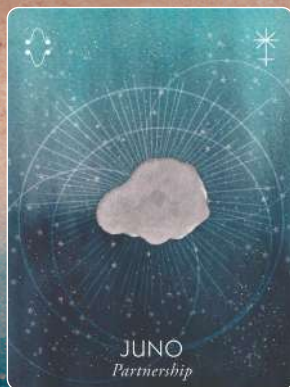
ジュノー JUNO パートナーシップ