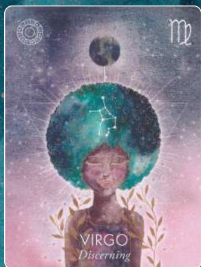
乙女座 VIRGO 洞察力