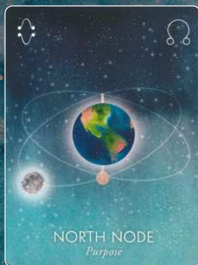
ノースノード NORTH NODE 目的