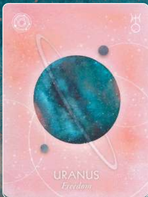
天王星 URANUS 自由