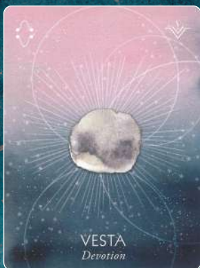
ベスタ VESTA 献身