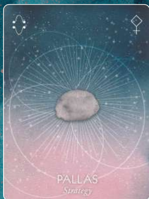
パラス PALLAS 戦略