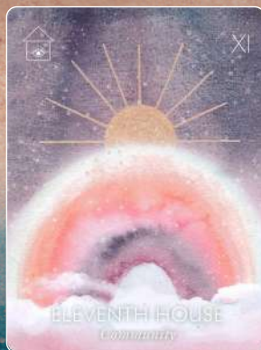
第11ハウス ELEVENTH HOUSE コミュニティ