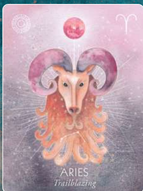
牡羊座 ARIES 先駆者